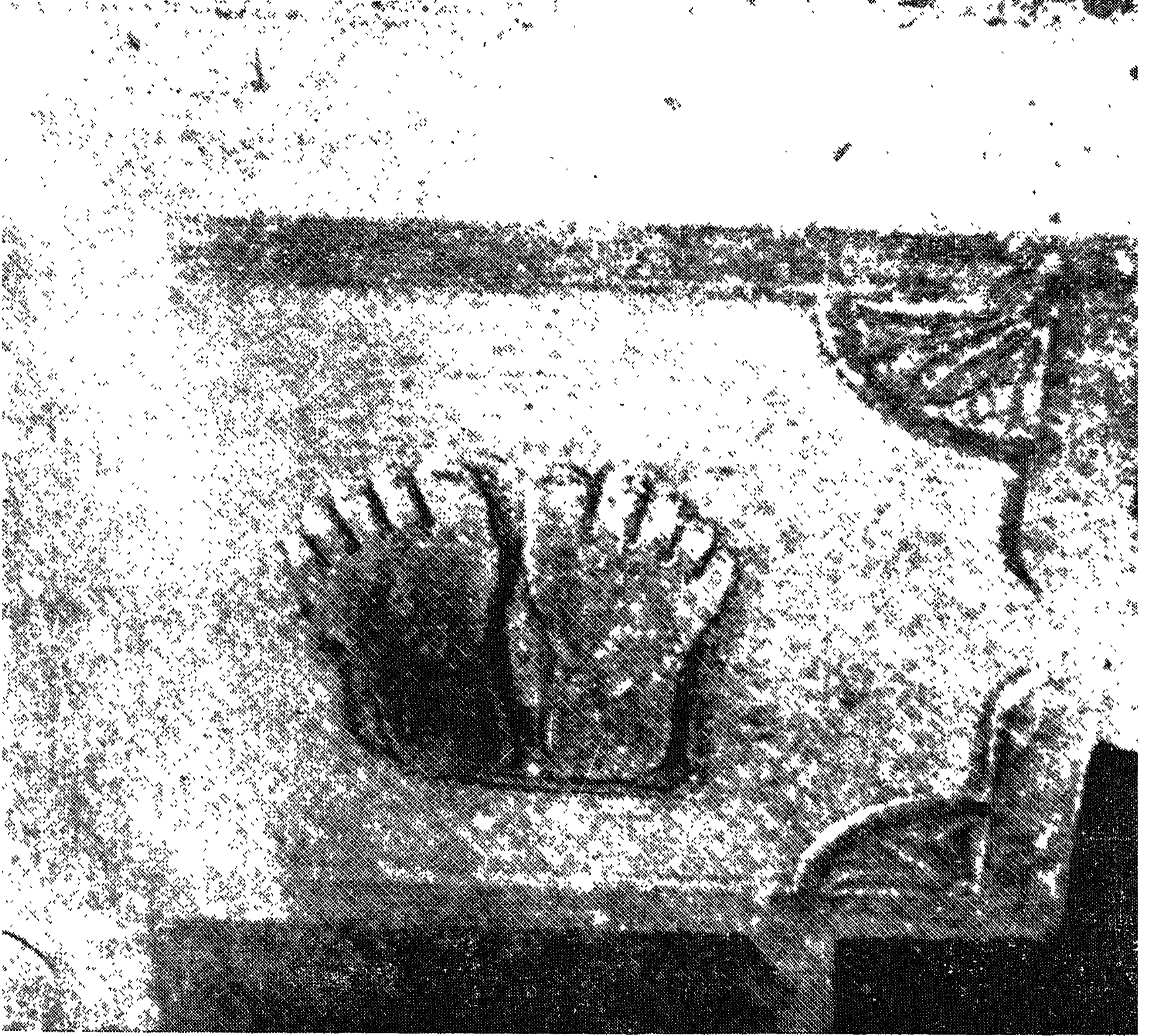
संत रविदास के चरण चिन्ह, कुम्भश्याम मंदिर, चित्तौड़गढ़